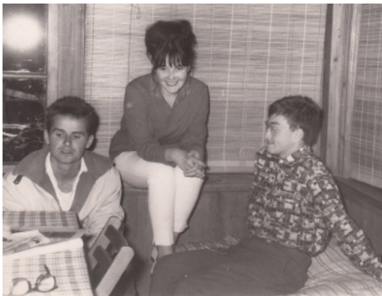
На фото Белла Ахмадулина и Керим Волковський (справа), 1963 год. Фотография из личного архива Керима Волковського, сделана Павлом Антокольским, публикуется впервые.