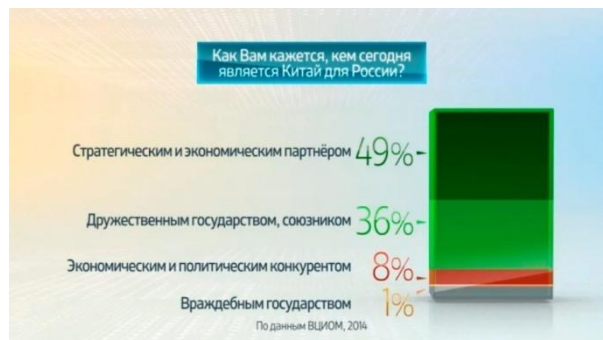
2. Цифры в статике

Проиллюстрируем сказанное. Для примера мы, в силу понятных обстоятельств, выбрали самый короткий видеоролик, состоящий всего из трех кадров, который несмотря на краткость наглядно представляет наши рассуждения.