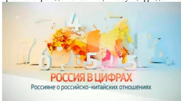
1. Тема видеоработы