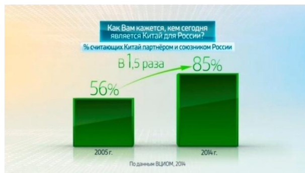
3. Цифры в динамике

На первом кадре обозначена тема инфограммы. Мониторинг общественного мнения по значимым для страны сферам является важным фактором демократии и серьезным поводом для размышлений государственного менеджмента. Отношения России и Китая в сегодняшней геополитической ситуации очень важны, т. е. данный текст однозначно ситуативен.